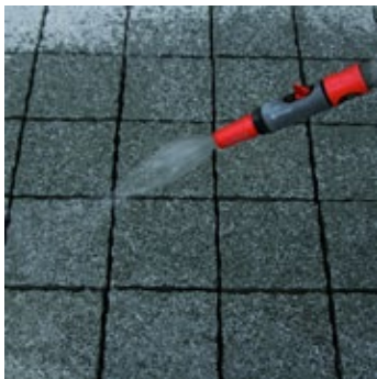
Povrch kociek a boky škár pred škárováním silne namočiť.