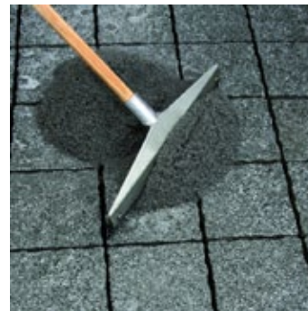
PCI Pavifix 1K Extra gumenou stierkou zatlačiť do škár.