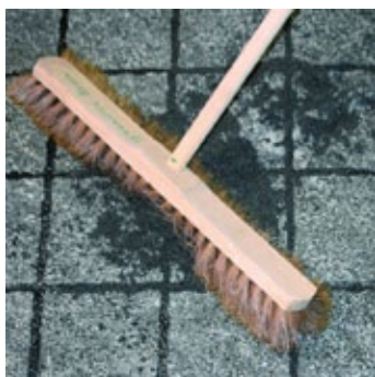
Zvyšky malty úplne odstrániť z povrchu mäkkou metlou.