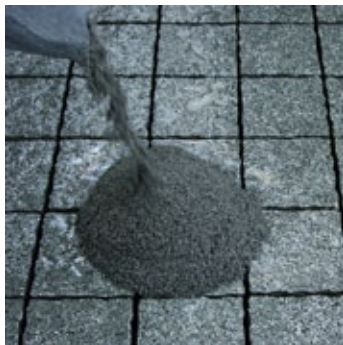
Vákuové vrečko nastrihnúť a čerstvý materiál nasypať na vlhký povrch.