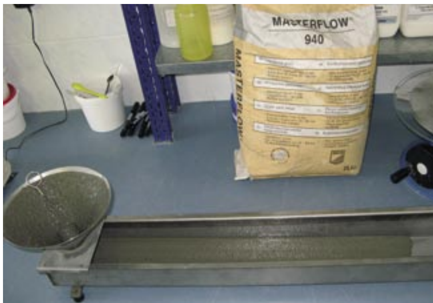
Prietokový zľab - zariadenie na skúšku tekutosti zálievok

Podlievanie ocelových konštrukcií alebo konštrukčných prvkov z betónu je neoddeliteľnou súčasťou stavebnej praxe, zvlášť v ťažkom strojárstve a v energetike. Na zálievkové hmoty sú všeobecne kladené vysoké nároky. Na správnu voľbu zálievky na konkrétne použitie je veľmi dôležité poznať základné parametre týchto hmôt. Straty pri poruchách či zničení zariadení alebo straty spôsobené výpadkom výrobných kapacít v dôsledku použitia nekvalitných zálievkových hmôt môžu byť značné. Požiadavky na vlastnosti a aplikačné podmienky neustále stúpajú. Je nutné preto výber správnej zálievkovej hmoty nepodceňiť.