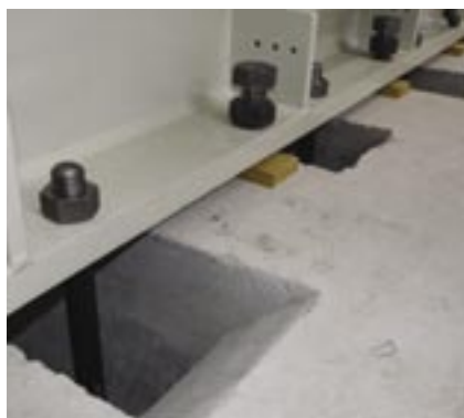
Hĺbkové zalievanie kotvenia strojov nad 500 mm hrúbky

Zálievkové hmoty spoločnosti BASF Slovensko spol. s r. o., Divízia Stavebné hmoty majú za sebou už viac ako niekoľko desiatok rokov intenzívneho vývoja a inovácií. Dodávame niekoľko typov zálievok pod rôznymi obchodnými názvami. Nosnými produktmi sú zálievkové hmoty Masterflow®. Systém zálievok dopĺňajú potom zálievkové materiály Emaco®, prípadne PCI.